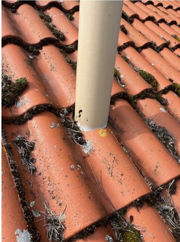
Otättheter och felaktigt utförd genomföring/avloppsluftning på tak.