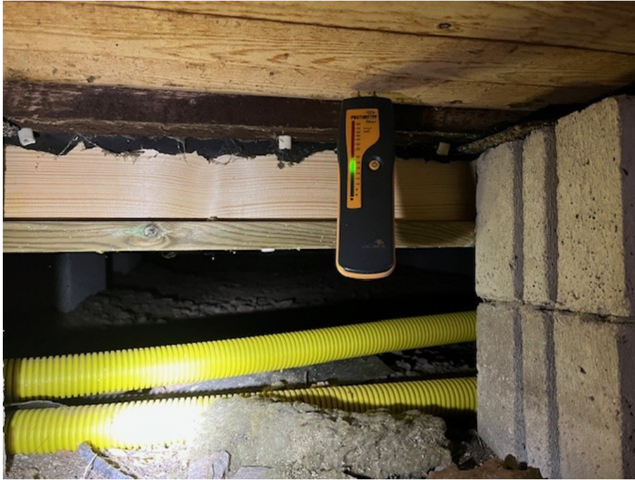
Fuktmätning i plintgrunden.