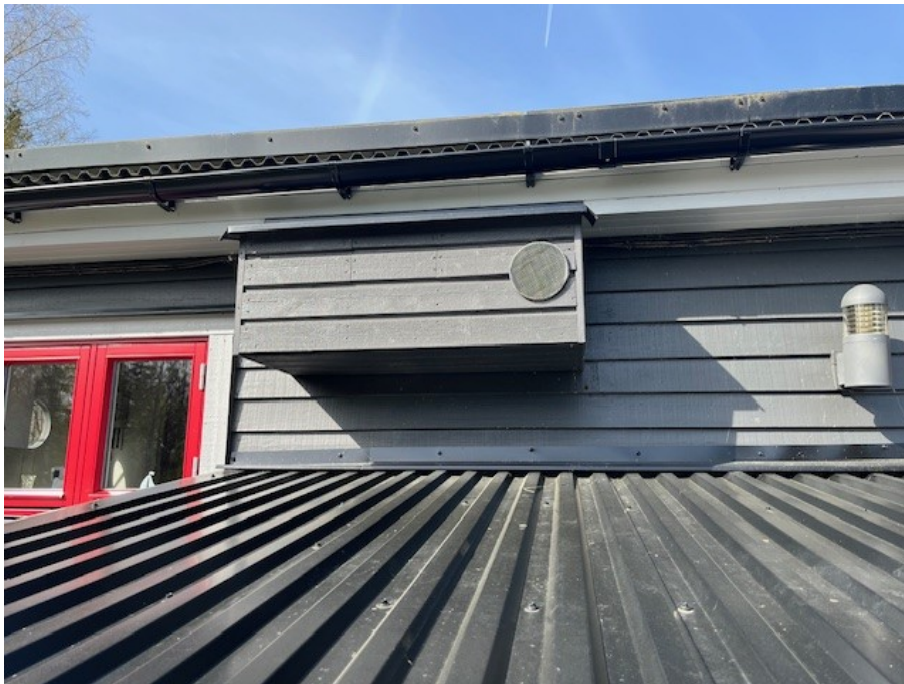
Imkanal/köksfläkt som kommer ut i fasad/trälåda på baksidan.