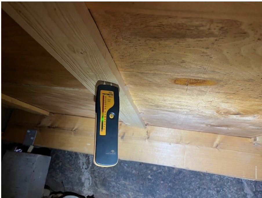
Fuktmätning i plintgrund/trossbotten.