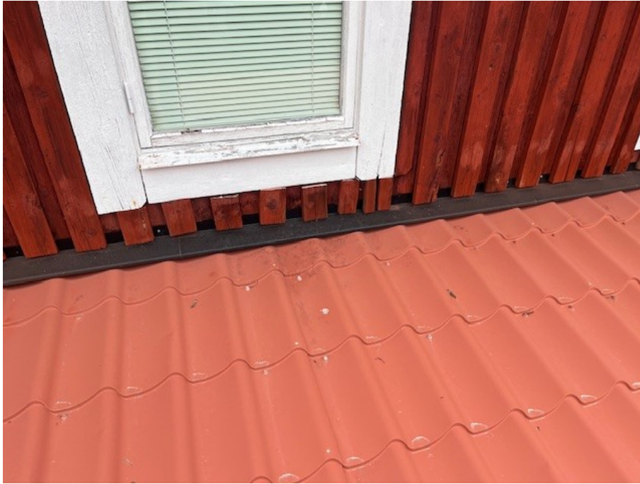
Plåtbleck som tätar/täcker något bristfälligt mot fasad och plåttak. Begynnande röta förekommer i nedkant av fasadpanel.